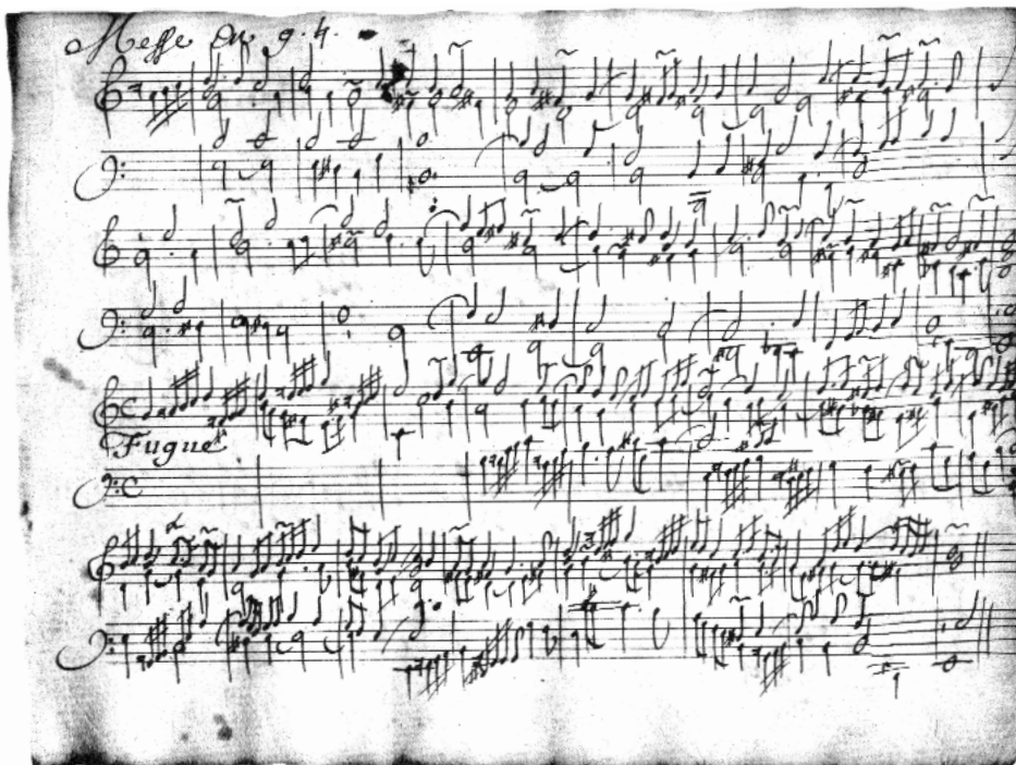
Messe en g, [Plein Jeu], n° 289, Fugue n° 290,